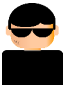
攻撃者 (A社のなりすまし)