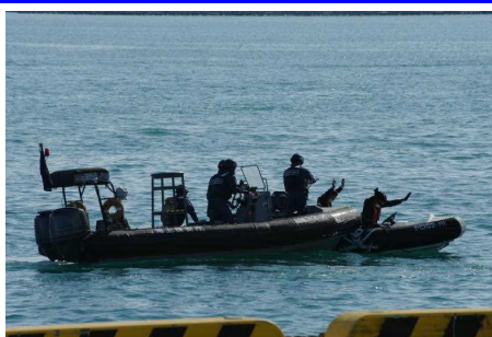
不審船の侵入阻止