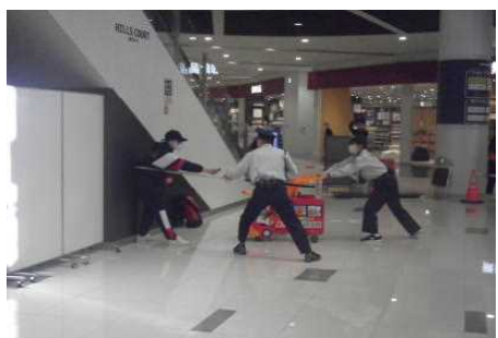
テロリストの制圧