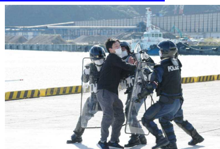
テロリストの制圧