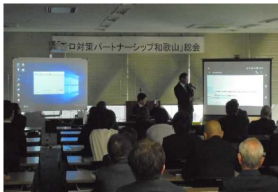
サイバーセキュリティ にかかるデモンストレーション