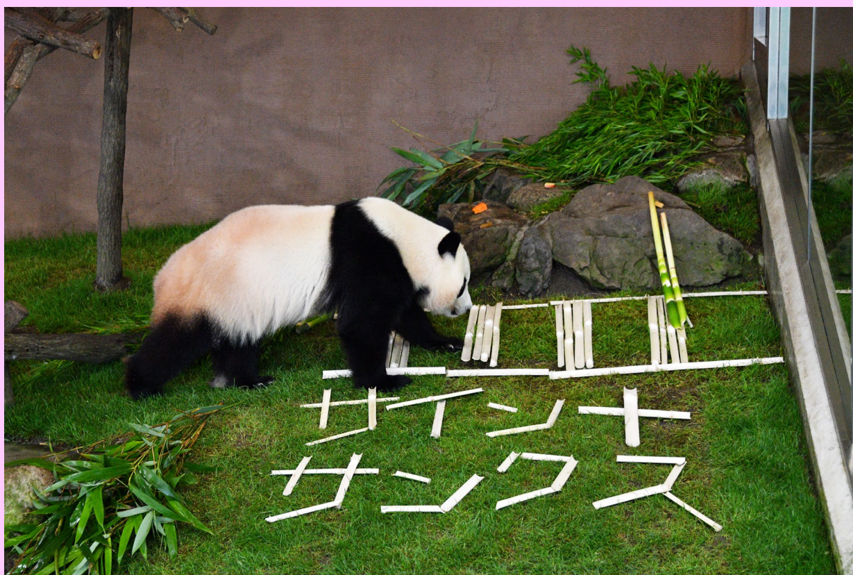
交通安全和歌山夢大使 「楓浜」