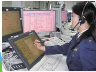
警察本部通信指令室