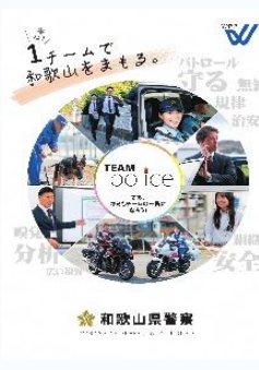
和歌山県警察本部