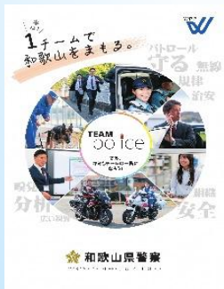
和歌山県警察本部