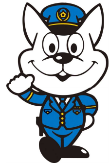
和歌山県警察 シンボルマスコット 《きしゅう君》

和歌山県警察本部 和歌山県人事委員会 〒640-8588 和歌山市小松原通一丁目1番地1 〒640-8585 和歌山市小松原通一丁目1番地 警察本部 TEL 073(423)0110(内線2626) FAX 073(423)0560 人事委員会 TEL 073(441)3763(直通) FAX 073(433)4085