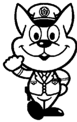
和歌山県警察シンボルマスコット 《きしゅう君》

〒640-8588 和歌山市小松原通一丁目1番地1 和歌山県警察本部警務部警務課採用係 Tel:073-423-0110 (内線2626)